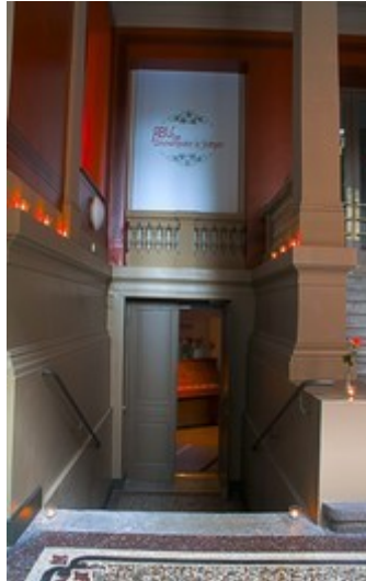
Eingang ins Theater