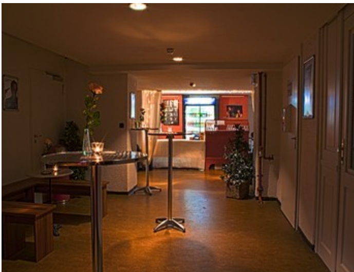
Blick ins Foyer

Mit öffentlichen Verkehrsmitteln kommt man entweder mit den Stadtbahnlinien U1, U9, und U34 oder den Buslinien 44 und 92 zu uns. Die Haltestelle zum Aussteigen für Bus und Bahn heißt: Österreicherischer Platz . Danach ist es ein Fußweg von 5 Minuten bis vor unsere Haustür.